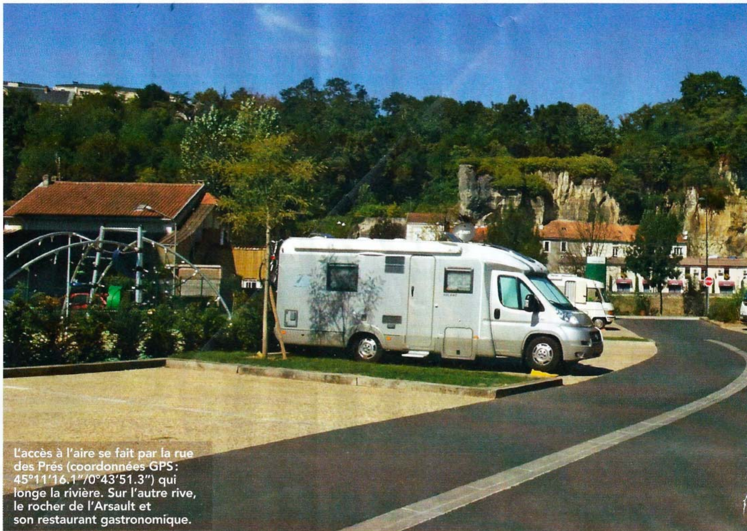
L'accès à l'aire se fait par la rue des Prés (coordonnées GPS: 45°11'16.1"/0°43'51.3") qui longe la rivière. Sur l'autre rive, le rocher de l'Arsault et son restaurant gastronomique.