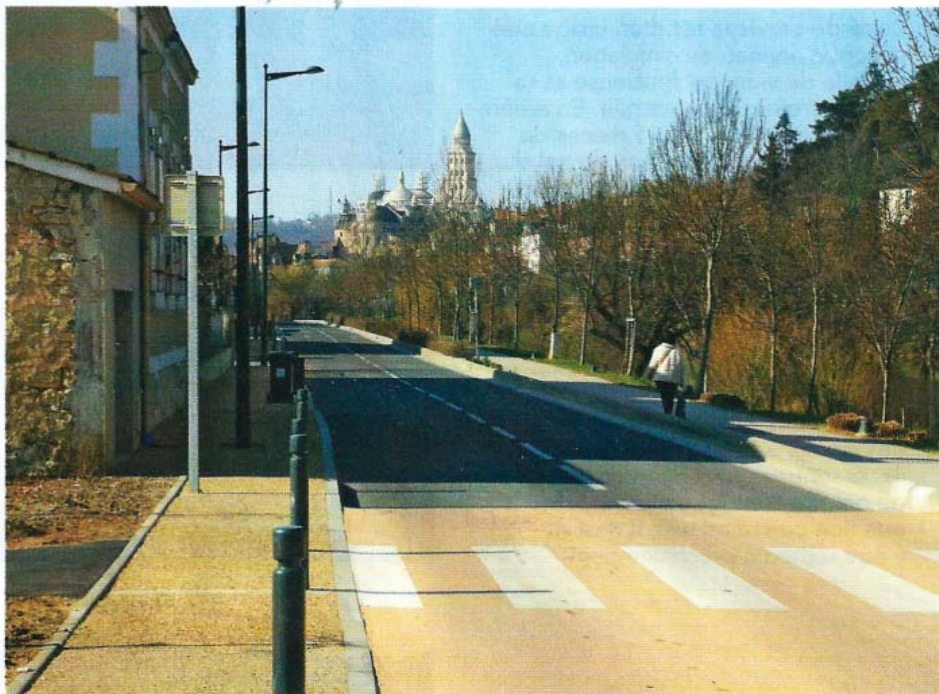
Depuis l'entrée de l'aire, on aperçoit la cathédrale Saint-Front, qui domine le centre historique de Périgueux.

études ont été entreprises en 2008. A la fin de l'année 2009, les travaux ont pu commencer après présentation du projet aux riverains. Le 1 er avril 2010, la nouvelle aire était inaugurée officiellement.