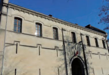
10 - Les nouvelles prisons - Maison d'arrêt de Périgueux