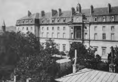
6 - Grand Séminaire (1829) sur les plans de Catoire dont la place sera dessinée par Cruveiller