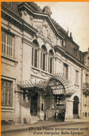
17 - Le Palace anciennement orné d'une marquise Belle-Epoque

réalise les plans de la Banque de France, 47 rue Gambetta en 1908. Il aménage dans le parc Gamenson un théâtre de nature « à l'antique », de 1912 à 1913, d'une capacité de 3000 spectateurs qui est inauguré par Raymond Poincaré, Président de la République.