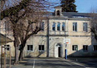
5 - Ancienne école des Frères (1850) devenue Lakanal en 1882