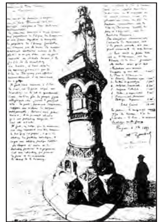
15 - Fontaine Plumancy, symbole de la ville de Périgueux

arrivée des eaux de la source du Toulon. A partir de 1866, il est chargé du suivi du chantier de la cathédrale Saint-Front.