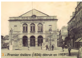
3 - Premier théâtre (1836) détruit en 1957

C'est un visionnaire qui selon la mode de l'époque met en scène les monuments. Au-delà des remparts, il édifie sa ville nouvelle dans un tracé harmonieux nord-sud.