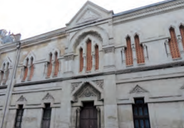
14 - La loge du Grand Orient de France (1868)