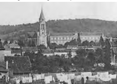
12 - Cathédrale Saint-Front : ensemble depuis l'est vers 1872