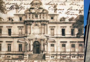
9 - L'Hôtel de Préfecture (1859 à 1864) avec son élégante marquise