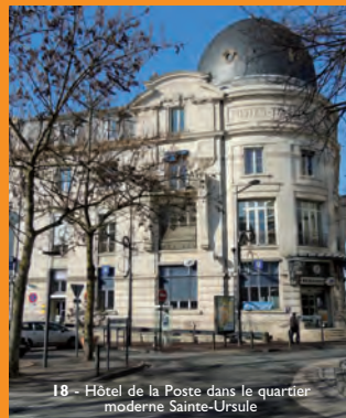
18 - Hôtel de la Poste dans le quartier moderne Sainte-Ursule

Il construit, non loin de sa propre demeure située 17 rue Bodin, le Palace en 1909/10. C'est une salle des fêtes municipale qui a perdu depuis sa magnifique marquise « Art Nouveau ». Il