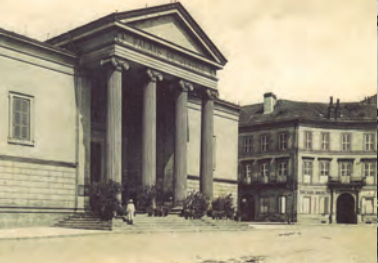
1 - Palais de Justice (1828), copie du temple d'Athènes