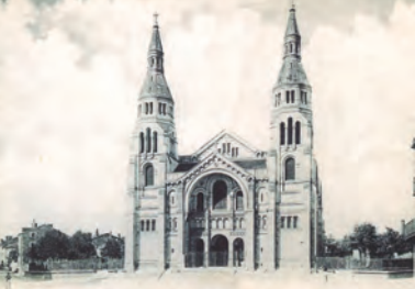
13 - Eglise Saint-Martin, la paroisse « des cheminots »