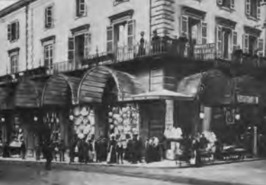
2 - Nouvelles Galeries (1838) avec leurs verrières