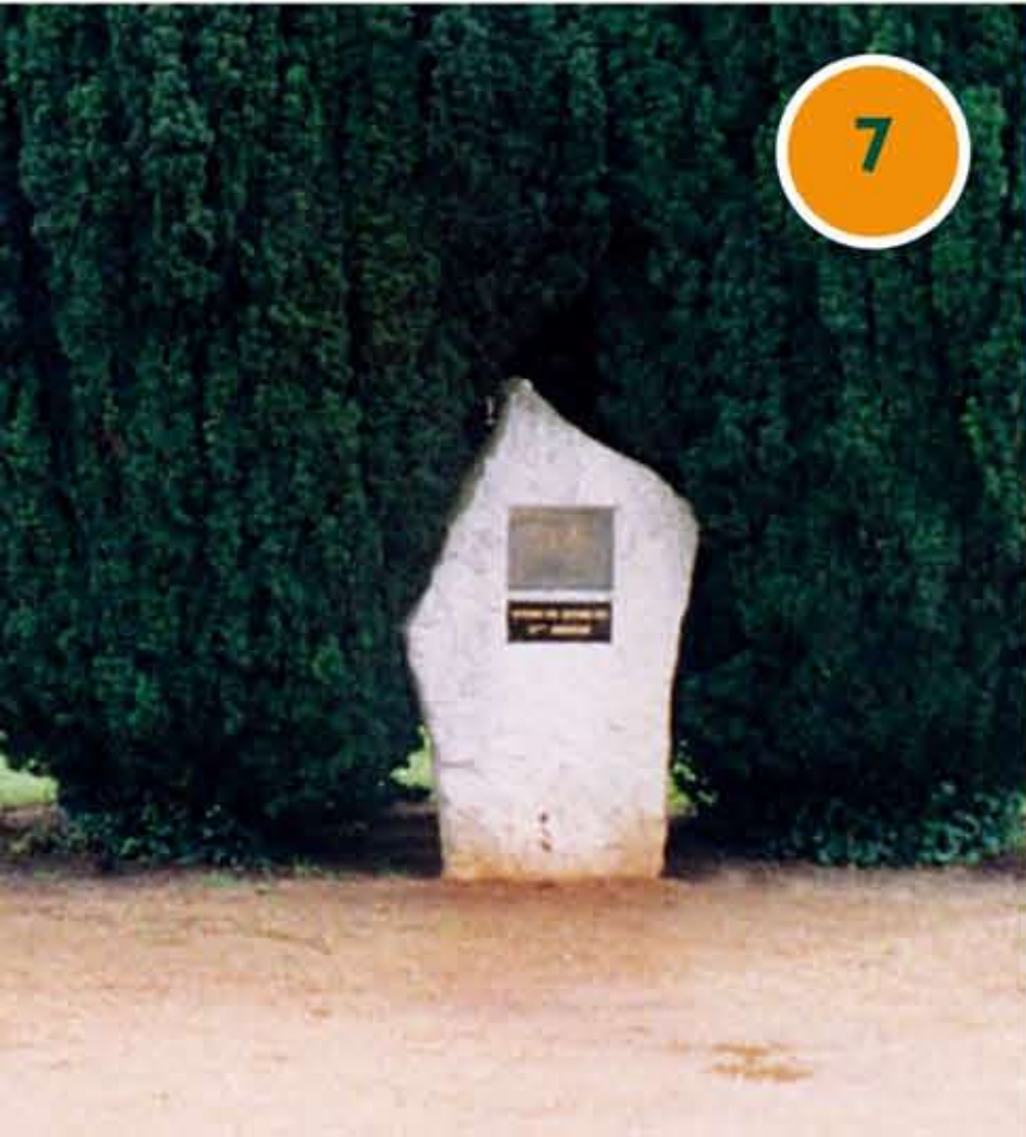
Rue de Metz