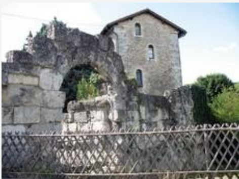
La Porte Normande, rue de Turenne