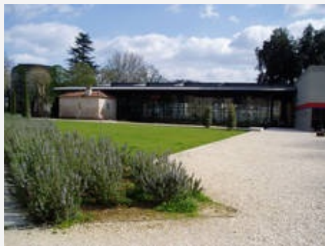
Le site-musée gallo-romain Vesunna