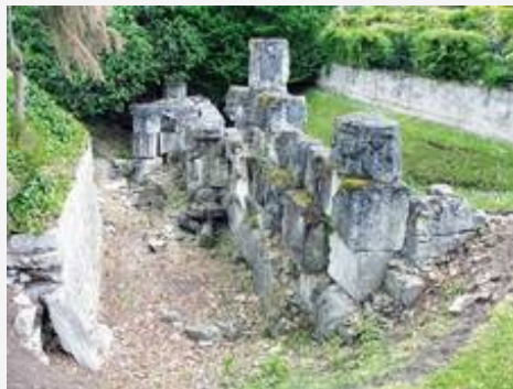
Les vestiges du rempart, rue Romaine