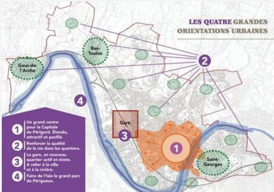
4 grandes orientations urbaines pour Périgueux