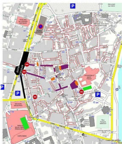
NUITS GOURMANDES 2018